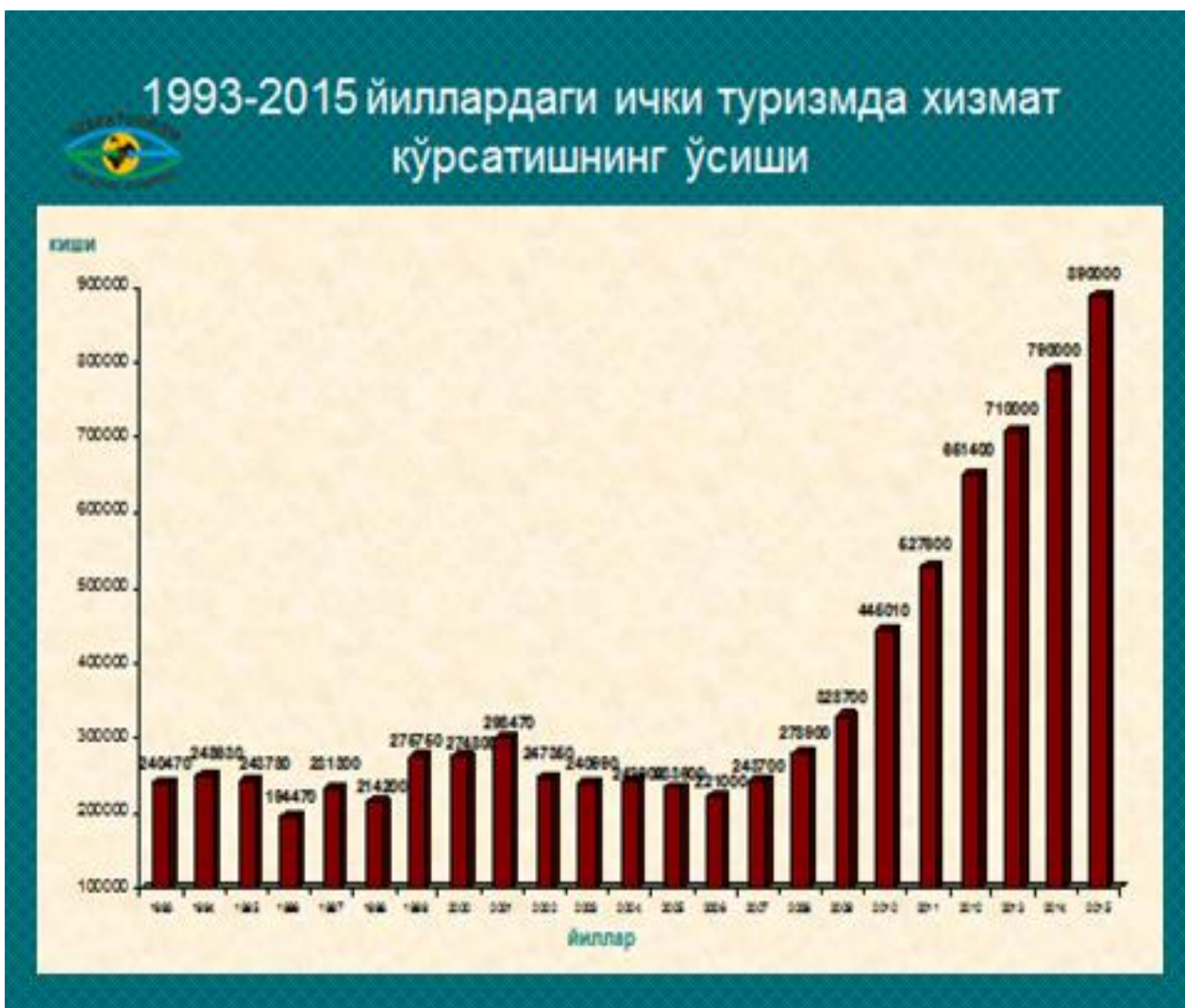
2-расм. 1993-2015 йилларда ички туризмда хизмат кўрсатишнинг ўсиши

2-расмдан кўришимиз мумкинки, йиллар давомида хизмат кўрсатишнинг ўсиши жадал суръатлар билан ривожланиб келган, бунга турли хил омиллар сабаб бўлган. 1993-йилда 240470 кишига хизмат кўрсатилган бўлса, 2015-йилга келиб бу кўрсаткич 890000 кишига етганини кўришимиз мумкин.